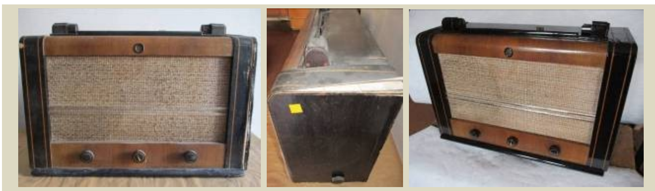
Pred a po ošetrení rádio Philips, 40. roky 20. stor.