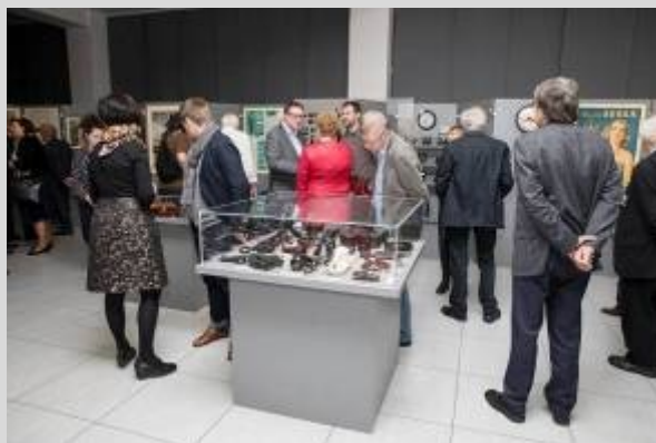
Výstava Čaro bakelitu približujúca bakelit ako plast mnohorakého využitia vyvezená do Českej republiky, kde v NTM Praha zahájila cyklus podujatí v rámci projektu „Made in Czechoslovakia - aneb průmysl, který dobyl svět“, ktorým si NTM pripomína 100. výročie vzniku Československa