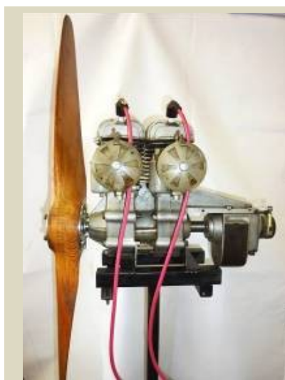
Letecký motor konštrukčne vyvinutý v Považských strojárňach (prvý pokus o zavedenie výroby leteckých motorov na Slovensku), 1949 – 1955