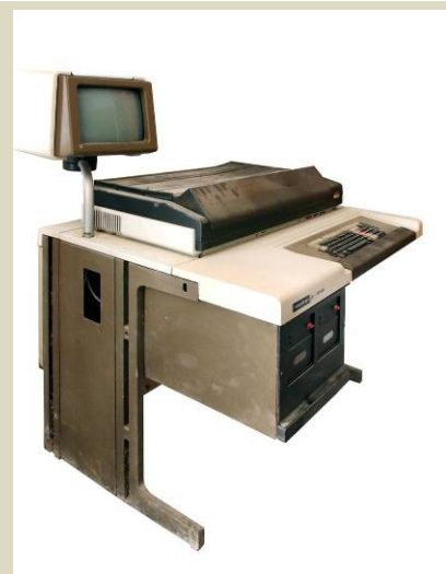
Počítač Robotron A 5130, NDR, 80.roky 20. stor.