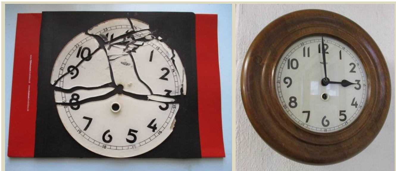
Nástenné hodiny Kienzle, 20. stor.