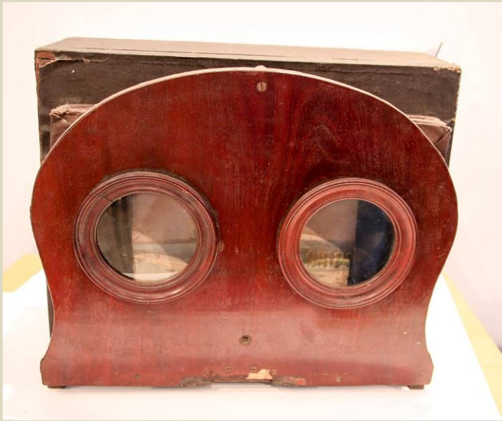
Polyorama panoptikum, optická hračka a 11 obrázkov mesta a krajiny, Francúzsko, 1820 – 1850