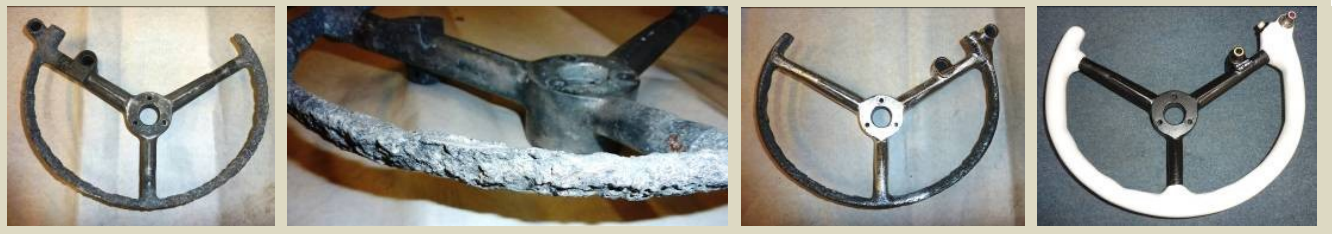
Stĺpik riadenia lietadla IL-18, 1960 – 70