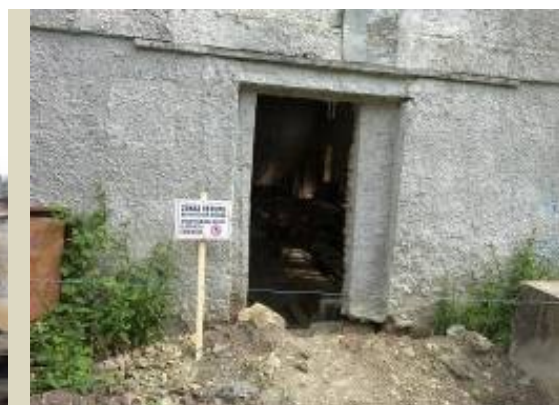
Stav pamiatky v roku 2017 a bezpečnostné opatrenia v roku 2018