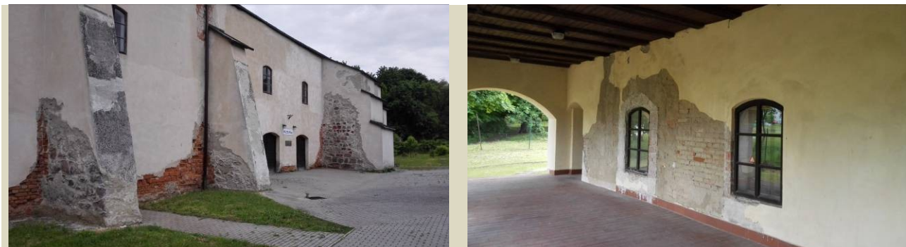
Aktuálny stav varne František – jeden z objektov NKP Solivar

V unikátnych technicko-technologických objektoch NKP Solivar v Prešove sú potrebné opravy a statické zabezpečenie objektu Četerne, odvodnenie objektu Varňa František, oprava fasády a zabezpečenie šachty Leopold v objekte Gápľa. Finančná situácia STM neumožnila v roku 2018 realizáciu týchto prác z bežného rozpočtu. V štádiu riešenia ostávajú reklamácie v Sklade soli rekonštruovanom v období 2013/2014 z Európskeho fondu regionálneho rozvoja „Investícia do vašej budúcnosti“. Najzávažnejšie nedostatky ako zatekanie a kanalizácia neboli doriešené.