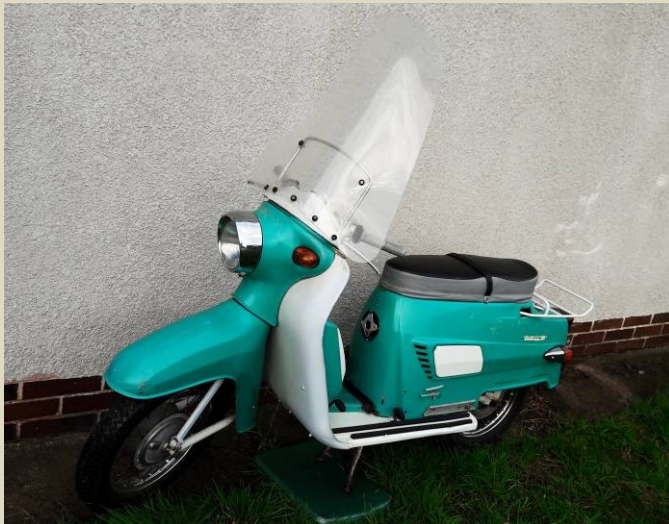
Motocykel Tatra S-125, Považské strojárne v Považskej Bystrici, 1968