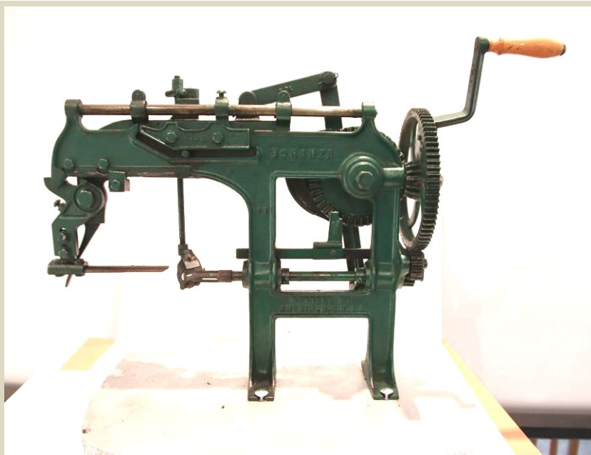
Lúpač jablák BONANZA, zariadenie bolo vyrobené a patentované okolo r. 1880 firmou GOODELL Co. BONANZA Mountain New Hampshire, USA