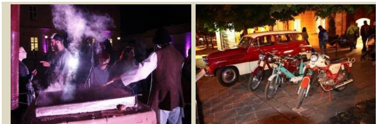
Noc múzeí 2018 v sídelných objektoch STM, varenie soli a inštalácia k československej produkcii automobilov a motoriek

** z toho 500 Eur z príspevku od Visit Košice