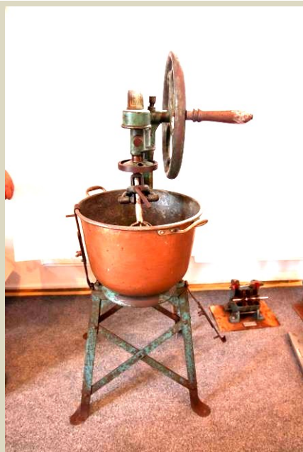
Ručný mixér, Česko, zač. 20. stor.