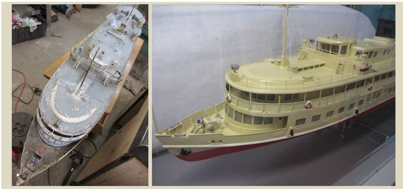
Výsledky ošetrenia makety (modelu) OL 800 Rossija