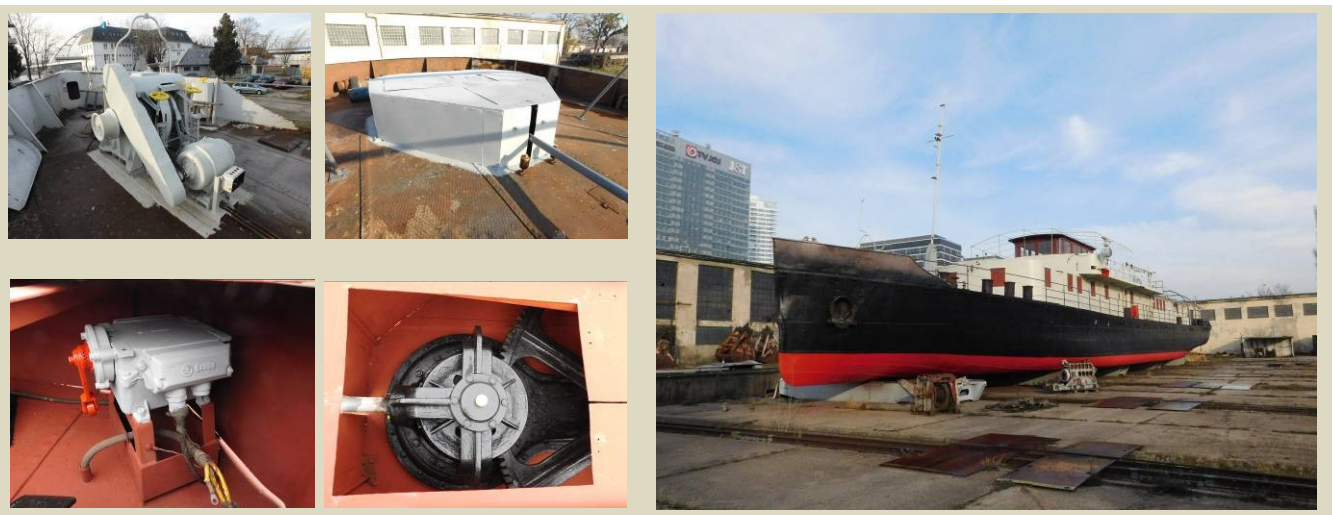
Detaily a stav remorkéru Štúrec v decembri 2018