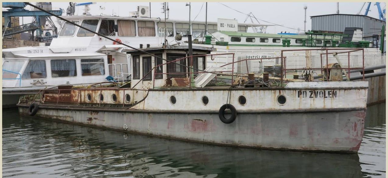
Komisia pre tvorbu zbierok STM odporučila nadobudnúť do zbierkového fondu Prístavný remorkér ZVOLEN z roku 1946, postavený v pražskej lodenici Antropius, slúžil v bratislavskom prístave