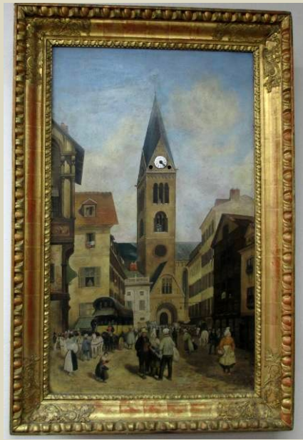
Obrazové hodiny s hracím mechanizmom, Viedeň, 1800 – 1830