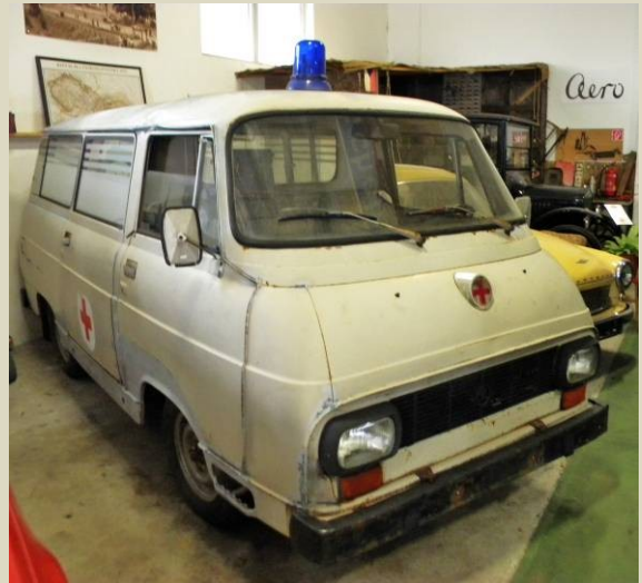
Automobil ŠKODA 1203 – sanitka, TAZ Trnava, 1983